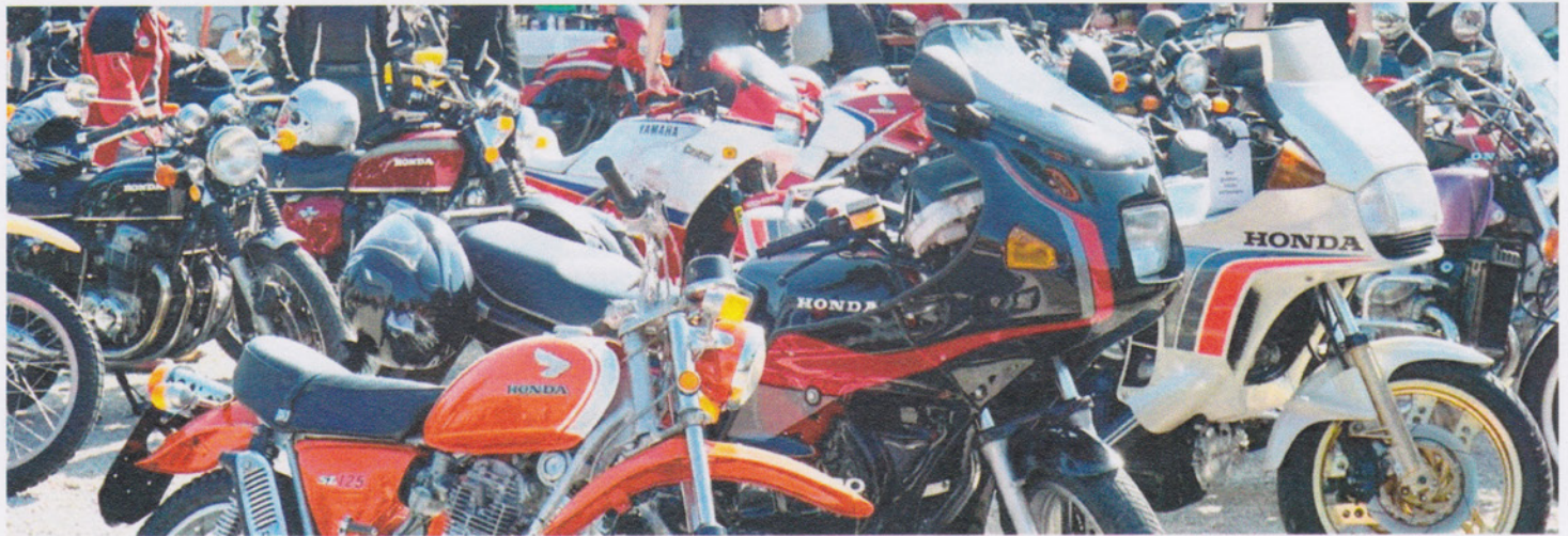
Treffen für japanische Motorräder